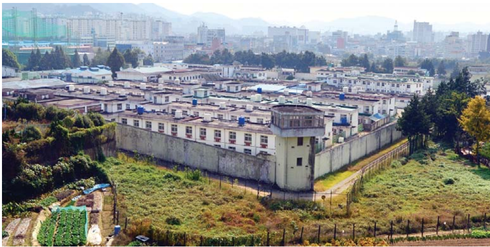
5·18민주화운동 당시 행방불명자 등의 암매장지로 지목된 옛 광주교도소 안팎에 대한 발굴 조사가 이르면 다음주 본격적으로 추진될 것으로 보인다.

5·18민주화운동 당시 행방불명자들의 암매장지로 지목된 옛 광주교도소 안팎에 대한 발굴 조사가 이르면 다음주 본격적으로 추진될 것으로 보인다. 12일 5·18기념재단에 따르면 이날 오전 김양태 기념재단 상임이사와 광주시 관계자 등이 법무부 담당자와 만나 광주교도소