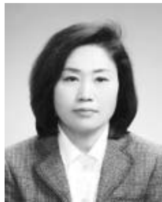
교수가 세계 3대 인명사전인 '마르퀴즈 후즈 후'에서 2018 알버트 넬슨 마르퀴즈 평생 공로상(The 2018

Albert Nelson Marquis Lifetime Achievement Award)을 수상했다고 밝혔다.