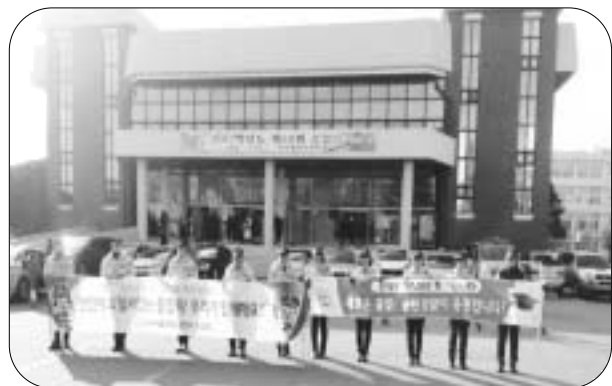
순천경찰, 학교폭력 예방활동 힘써 순천경찰서 여성청소년과는 건전한 졸업식 문화 정착을 위해 청암고 졸업식 행사에 참석, 졸업식 후 학생들 사이에서 이루어질 수 있는 감악적 뒷풀이 예방활동을 실시하였다.