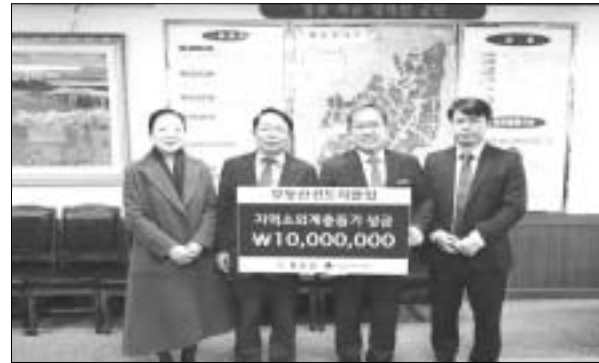
무등산컨트리클럽이 화순 관내 어려운 이웃에게 사용해 달라며 성금 1,000만원을 기탁했다. 4일 화순군에 따르면 무등산컨트리클럽(화순읍 서태리 소재) 임직원 이 이날 화순군청을 방문, 성금

1,000만원을 기탁했다. 군은 전달된 성금은 전남사회복지공동모금회를 통해 지역 내 어려운 이웃에게 전달할 예정인데 이번 성금으로 대상자의 발걸음과 지원에 더욱 박차를 가할 수 있게 됐다. 한편, 화순군과 전남사회복지공동모금회는 지난 11월20일부터 2018년 1월31일까지 73일간 나눔으로 행복한 나라'라는 슬로건 아래 '희망 2018나눔캠페인'을 펼치며 많은 분들이 나눔에 관심을 갖고 참여해 줄 것을 호소했다. 후원에 관한 문의는 전남사회복지공동모금회(061-902-6807)나 화순군 희망복지지원단(061-379-3942)으로 하면 된다. 화순=박순철 기자