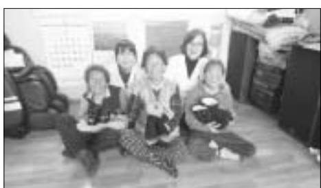
고흥군 보건의소에서는 도양읍 익명의 기부자로부터 털부츠, 슬리퍼

등 신발 100켤레를 전달받아 다문화가정, 독거노인, 조손가정에 따뜻한 온정을 전달했다. 이는 작년 말 방한용품(목도리, 장갑, 모자) 기부에 이은 두 번째 선물전달이다. 보건의소 방문팀은 어려운 이웃들을 위해 직접 산타가 되어오는 마음으로 어느 때보다 즐거운 마음으로 선물을 전달했으며, 새해