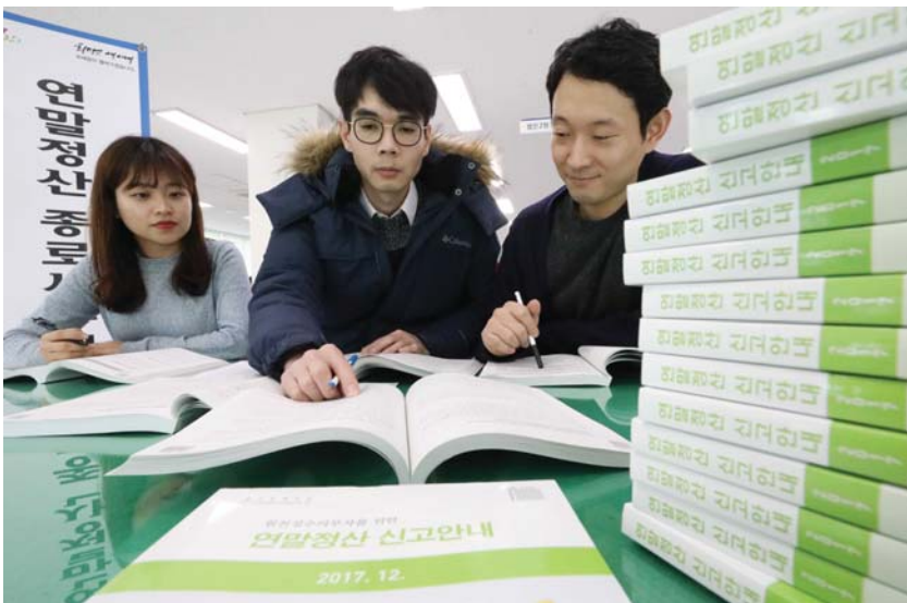
연말정산 실제 상세 데이터를 기반으로 연봉만 입력하면 8가지 연말정산 정보를 알려주는 서비스가 선보였다. 한국납세자연맹(회장 김선택)은 국세청에 정보공개를 요청해 받은

2015년 귀속 연말정산 인원 1733만 명의 연봉, 과세정보 등의 정보를 기반으로 근로자가 자신의 연봉만 입력하면 연말정산과 관련한 정보를 알려주는 ‘연말정산 탐색기’를 서비스한다고 17일 밝혔다.