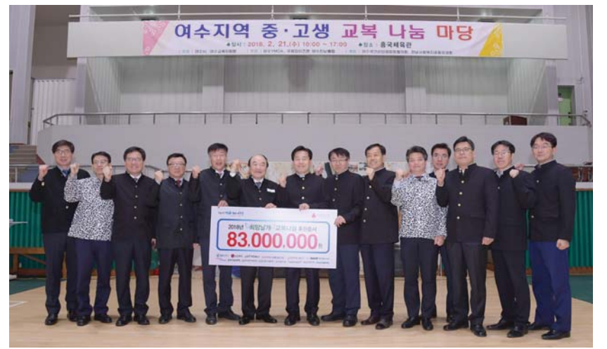
21일 희망날개 교복나눔 후원증서 전달식이 열린 여수시 흥국체육관에서 추첨한 여수시장과 저소득층 교복구입비로 8300만 원을 후원한 지역 기업 관계자들이 파이팅을 외치고 있다.