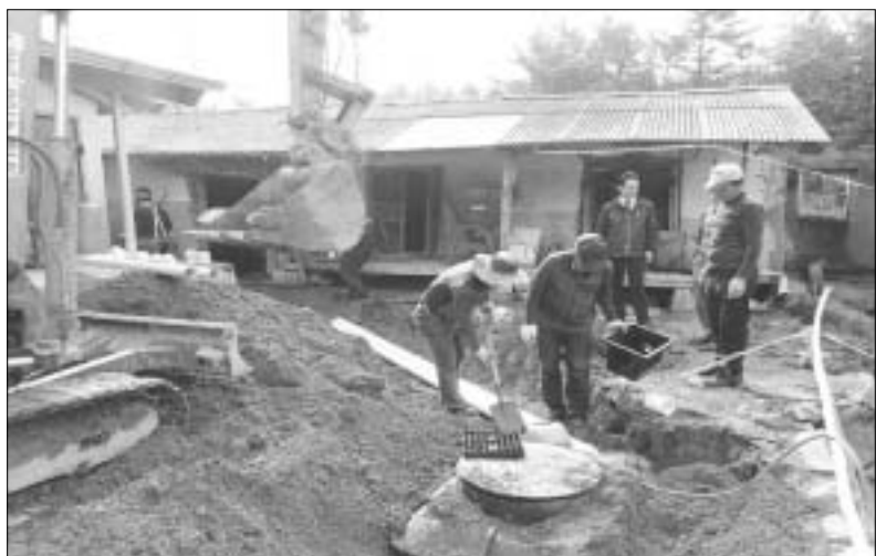
장흥군 대덕읍이 지역 재능기부단체와 손잡고 재래식 화장실을 사용하는 저소득 가정에 실내 화장실 설치를 지원하고 나섰다.

다. 집 밖에 설치된 재래식 화장실을 아직 사용하고 있어 낮은 바에는 아이 혼자 화장실에 가기도 어려운 형편이었다. 곳은 날씨가 겨울철에는 화장실 이용에 더욱 불편이 컸으나, 경제적인 부담으로 화장실 보수를 망설였다. 위 모 씨는 "우선은 실내에 화장실이 생겨서 딸 아이가 가장 기뻐한다며 이렇게 나서서 일을 해주니 진심으로 고맙다"고 감사의 뜻을 전했다. 이제껏 대덕읍장은 "지역 재능기부단체와 뜻을 모아 복지수요를 충족한 좋은 사례를 남겼다"며, "재능기부단체에 감사드리고, 앞으로도 지역민이 꼭 필요한 복지 서비스 제공에 노력하겠다"고 말했다.