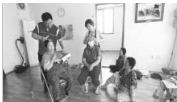
영광군 낙월면에서는 28일부터 30일까지 교통이 불편한 도서지역