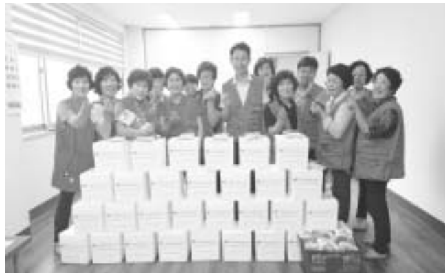
독거노인 등 40세대 전달