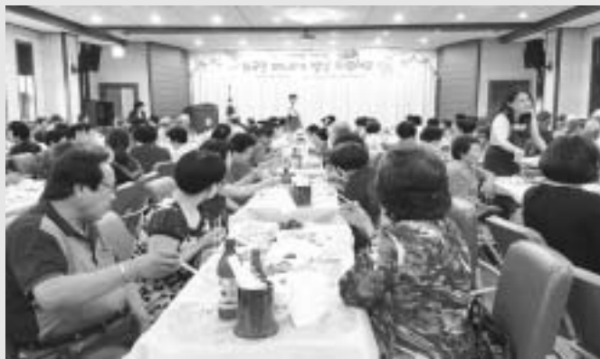
영암군 건강가정·다문화가족지원센터(이하 센터)에서는 지난 6월 26일 결혼이주여성들이 직접 출신국의 요리를 만들어 지역어르신과 다문화가족 부모님들께 점심식

사를 대접하는 행사를 삼호종합복지회관에서 가졌다. 2015년부터 3년째 실시하고 있는 ‘아버님! 어머니! 외국인 며느리가 밥상차렸어요’는 지난 4월 5일부터 4일간 실시된 2018 영암왕인문화축제 기간 동안 다문화가족관 부스 판매 수익금의 일부와 후원금으로 결혼이주