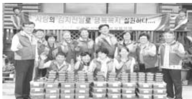
영암군 도포면에서는 최근 정성 가득한 사랑의 반찬 나누기 봉사활동을 펼쳤다. 이번 말반찬 나눔 봉사활동은 여름철 입맛을 돋게하는 열加里 열무

김치와 별치파리볶음 등 맛갈스럽고 정성이 담긴 반찬을 만들어 관내 홀로사는 어르신과 장애인 60세대에 협의체 위원들이 직접 전달과 함께 대상자들에게 병행하여 이웃간의 정을 돈독히 했다. 이날 말반찬 만들기 봉사활동에는 무더위에도 아랑곳 하지않고 협의체 위원들이 다함께 참여 구슬땀 을 흘리며 말반찬들기 일손을 도와주어 화합과 우의를 다질 수 있었다. 이날 수혜 혜택을 받은 대상자 어르신들께서는 정말 맛있고 반찬과 정성이 가득한 반찬을 만들어 주어 맛있게 잘먹고 있다며 감사 전화도 잊지 않았다. 인체를 편지는 지역사회보장협의체 위원들이 바쁜 영농철과 장마철에도 불구하고 위원들이 다함께 참여해 말반찬 나누기 봉사활동을 해주셔서 감사하고 조그마한 시간과 정성으로 자칫 소외되기 쉬운 우리 작은 이웃에게 도움을 줄 수 있어 보람을 느낀다고 말했다.