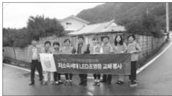
저소득 취약계층 17세대 지역사회보장협의체 특화사업 일환으로 가정 내 소규모 수리·수선, 형광등 교체에 어려움을 겪고 있는

근 저소득 취약계층 17세대를 방문해 낡고 어두운 안방 및 주방의 조명등을 LED등으로 교체하는 봉사를 했다. 협의체 위원들의 권유로 이뤄진 이번 사업은 수북면 지역사회보장협의체 특화사업 일환으로 가정 내 소규모 수리·수선, 형광등 교체에 어려움을 겪고 있는 담양=박종영 기자