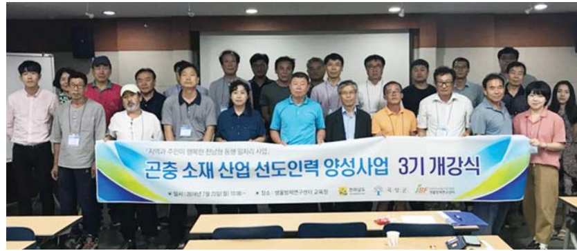
로써 곡성군 내 곤충산업 분야 취·창업 희망자의 신청을 통해 진행하고 있다.

곡성군, 곤충산업 취·창업 희망자 30명 대상 내달 31일까지 교육...미래성장산업으로 각광