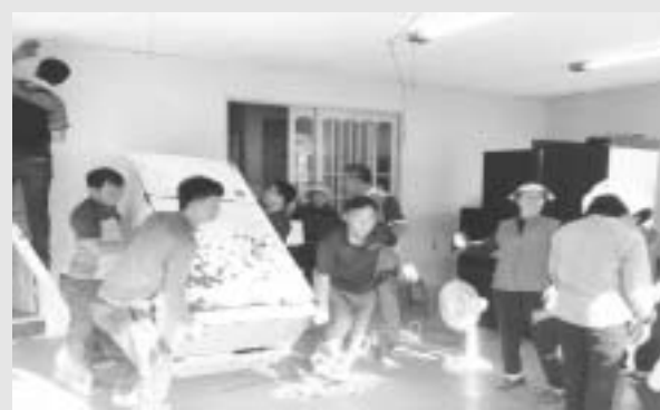
함평군 나산면은 지난 25일 지역사회보장협의체, 여성단체, 청년회 등과 함께 소외계층을 위한 집수리 봉사활동을 실시했다.

이번 봉사활동 대상 가구로 선정된 3가구는 모두 주거환경이 매우 열악한 장애인 등 취약계층이다.