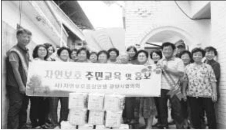
광양시 진월면 선소경로당을 찾아 주민 환경교육을 마치고 기념촬영을 하고 있다.