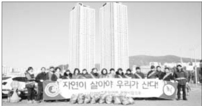
광양시자연보호협의회 회원들이 정화활동과 캠페인을 마치고 중마시장 주차장에서 기념 촬영을 하고 있다.