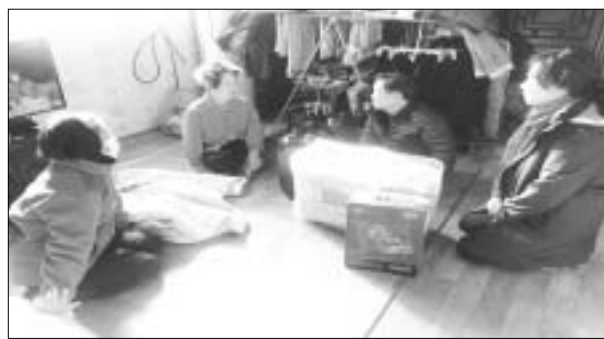
함평군 나산면이 지역 내 소외가 60가구를 직접 찾아 각종 생활 애로