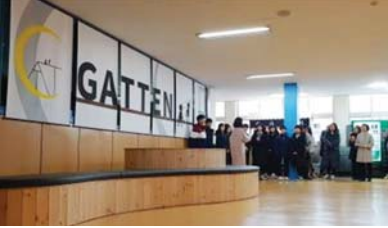
자동화실비공고 학생들이 만든 것들