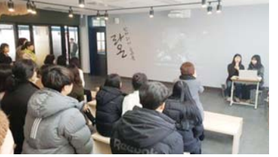
첨단고 학생들이 만든 라온