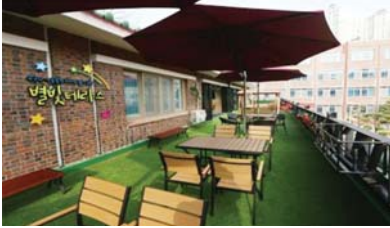
광덕중 옥상에 조성된 별빛 테라스