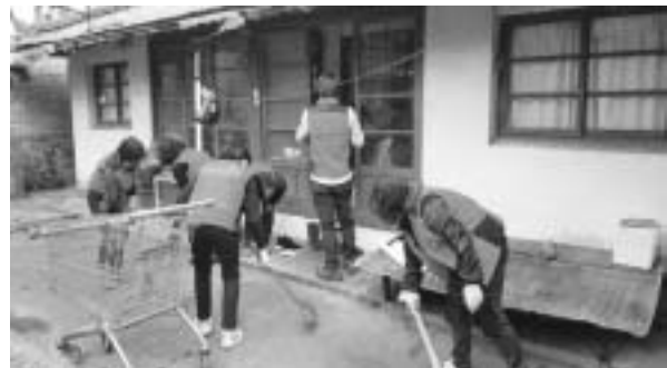
고흥군은 지난 15일 V(Volunteer)-Day를 통해 취약계층 가구를 방문

하여 봉사활동을 펼쳤다고 전했다. V-Day는 공무원들로 구성돼 매월 셋째 주 금요일에 진행되며, 각 실과소 및 읍면 별로 결연 취약계층 가구를 방문해 청소 및 안부 살피기 등을 진행하는 사업이다. 또한 V-Day는 직원 3분의 1이