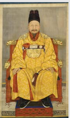
장’을 덕수궁 인근에서 개최한다.

그는 “추모를 항쟁으로 바꿔놓은 것이라 생각한다. 그 당시 추모는 ‘왕에 대한 직접적인 추모’가 있었지만, 국권 소멸에 대한 불인정의 의미도 담겨 있었다. 항쟁적