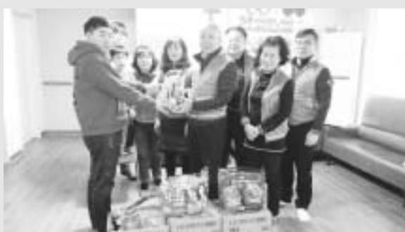
여주시청 행복나눔미 봉사팀이 다.

문수동 요양원을 찾아 봉사활동을 펼쳤다. 여수시에 따르면 봉사팀 10명은 최근 ‘사랑의 동산’ 요양원을 방문해 시설 인박을 청소하며 준비한 위문품을 전달했