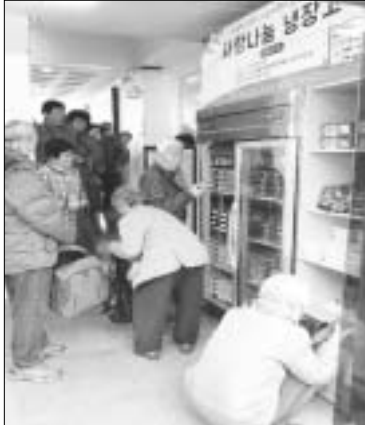
장흥읍지역사회보장협의체가 운영하는 '사랑나눔 냉장고'에 주민들의 관심이 높아지고 있다. 사랑나눔 냉장고는 기관·사회

단체와 주민들의 참여로 월 1회 운영되며 장흥읍지역사회보장협의체가 관리하고 있다. 기부 받은 식재료를 주변 이웃과 함께 나누는 사업으로 누구나 자발적으로 기부하고 필요한 만큼 가져가는 것이 기본 운영방식이다. 기부식품을 나눔 냉장고에 넣어두면 나눔을 받고 싶은 주민은 필요한 식품을 자유롭게 가져가는 방식으로 한 끼 식사를 위한 식재료를 주고받을 수 있다. 시행 초기 소수의 후원으로 시작했으나 업무협약 등을 통해 후원자들이 점점 늘어나고 있다. 여기에 자율적인 참여단체의