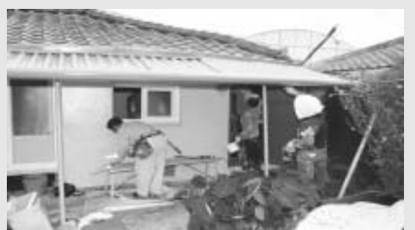
고흥군은 주택수리가 필요하나 지역으로 수리하기 힘든 저소득층 주민들의 주거안정을 위하여 19억 원을 투입, 주거환경 개선사업을 실시한다. 이를 위해 최근 한국토지주택공사(LH) 광주전남지역본부와 2019년 수선유지급여 사업 위수탁 협약을 체결하고 본격적인 사업추진에 착수했다. 고흥군은 협약에 따라 한국토지주택공사와 올해 300가구를 대상으로 주택 노후도에 따라 경·중·대보수로 구분 후 가구당 최

대 10,260,000원을 들여 도배장판 교체, 부엌·욕실 개량 및 지붕수선 등을 지원한다. 건강을 위협하는 발암물질인 슬레이트 지붕에 대해서는 슬레이트 철거사업과 연계하여 슬레이트 지붕 철거 후 지붕개량을 지원할 예정이다. 군 관계자는 "주거약자의 노후된 주택을 정비해 이들이 쾌적하고 안전한 주거환경을 영위할 수 있도록 사업추진에 최선을 다하겠다"고 밝혔다. 한편, 지난해 고흥군은 사업비 11억을 투입해 저소득 182가구에 주택수리를 완료하여 주민들로부터 호응을 얻었다. 김승호 전남동부취재본부장