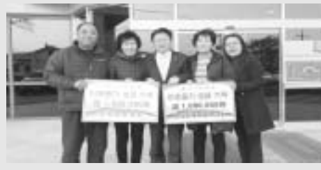
장흥군 안양면은 지난 15일 '찾아가는 생신축하단, 장수어르신 생신위문 사업' 기탁식 및 협약식을 가졌다고 전했다.