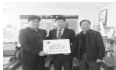
본 한 분께 돌아갈 수 있어 기쁘다는 소감을 밝혔다.