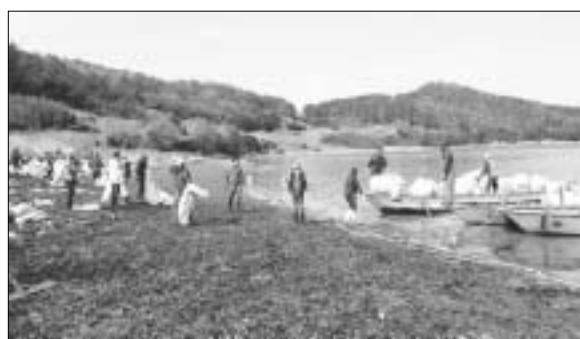
완도군에서는 손길이 닿지 않는 기(페스티로폼)를 수거하고, 11일에는 완도통발자율관리공동체(위원장