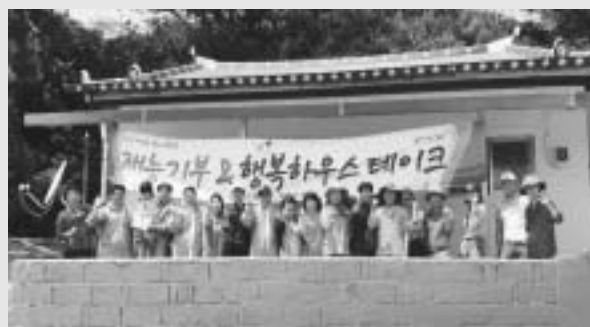
여주시 허가민원과 직원 20명이 최근 화성면 여자리 홀몸어르신