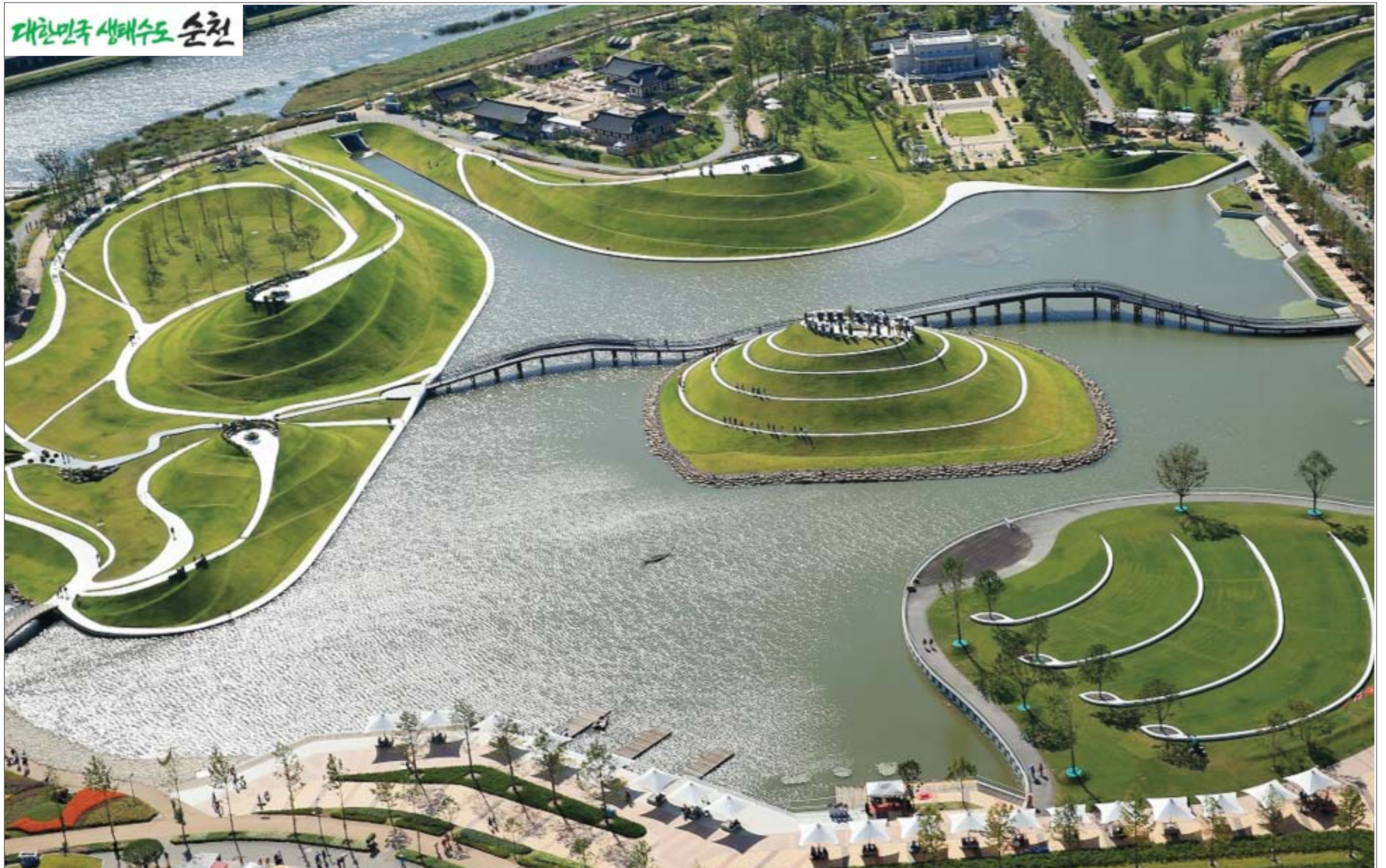
대한민국 생태수도 순천