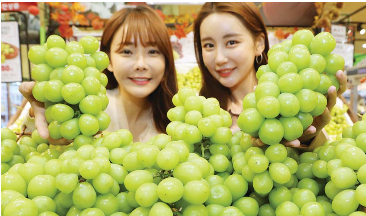
샤인머스켓으로 가을을 느껴보세요! 16일 오전 롯데마트 서울역점에서 모델들이 '영천 샤인머스켓'을 소개하고 있다. 롯데마트는 청포도 '샤인머스켓'의 주요 국내 산지인 경상북도 영천시와 협약을 맺고 오는 17일부터 23일까지 '영천 샤인머스켓(1.5kg/1박스)'을 2만 4800원에 판매한다.