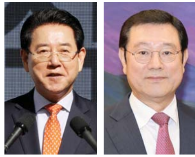
김영록 전남지사 이용섭 광주시장

이번 10월 조사에서 17개 시도지사 전체의 평균 긍정평가(지지율)는 46.2%로 9월(44.8%) 대비 1.4%p 높았다. 평균 부정평가는 41.4%로 9월(42.6%)보다 1.2%p 낮은 것으로 집계됐다.