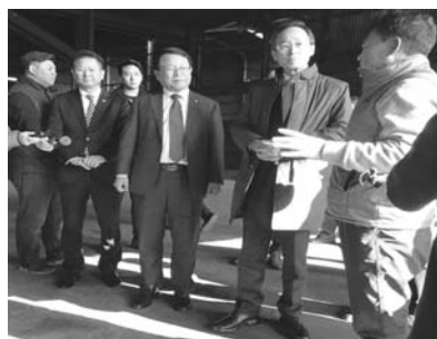
이름을 함께 했어야 했다. 다시 한 번 깊이 사과드린다"고 말했다.