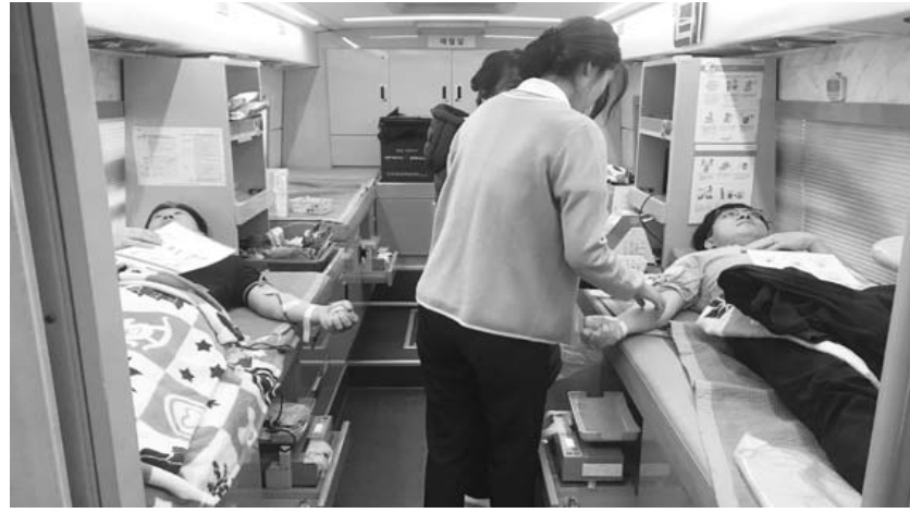
한편 군은 매년 대한적십자사 광주전남혈액원과 함께 헌혈운동을 실시하여 헌혈을 통한 생명 나눔을 실천하고 있으며, 2019년 헌

따라 혈액을 안정적으로 확보하기 위해 실시한다. 헌혈 과정에서의 감염을 막기 위해 모든 방문자의 발열과 여행 기록, 호흡기 증상 등을 철저히 확인하고 진행된다. 보건소 관계자는 "어려운 상황이지만 소중한 생명을 살리는 작은 실천인 헌혈을 위해 군민들의 적극적인 참여와 관심이 지역 의료기관에게 힘이 되길 바란다"고 덧붙였다.