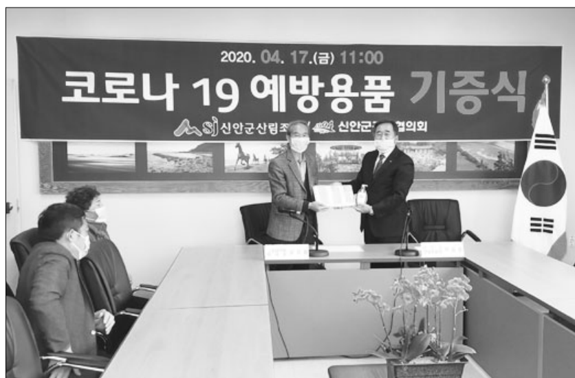
2018년 9월에 설립하여, 관광 친철도 보 등 신안군 관광발전을 위해 노력하고 있다.