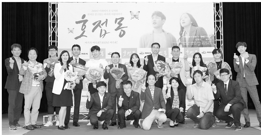
지난 29일 진남문예회관에서 여수시의 다섯 번째 웹드라마 '호접몽'의 시사회를 성황리에 마치고 권오봉 여수시장과 출연배우, 제작진, 여수시 관계 공무원 등이 기념촬영을 하고 있다.