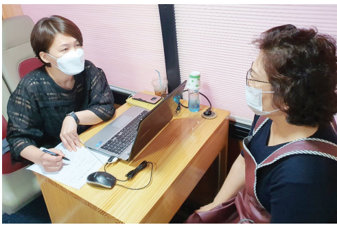
최근 여수시와 국민권익위원회가 합동으로 여수전통서시장에서 시장 상인이 전문 조사관과 고충 상담을 하고 있다.