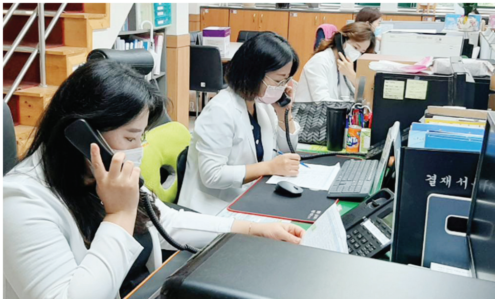
계층의 가정 방문에 어려움이 있는 데, 전화모니터링을 통해 각 대상자의 건강상태 유지 및 만성질환의 관리에 철저를 기하겠다”고 말했다.

이 있는 65세 이상 독거노인 및 75세 이상 부부노인 가구, 기초생활보장수급자, 차상위계층 등이다. 하지만 코로나19 사태로 인하여 대상자 가정을 방문하기 힘들어져, 대상자별 전담인력을 지정하여 1주 1회 이상 전화 모니터링을 통해 혈압, 당뇨 등 전반적인 건강체크 및 합병증 예방관리, 의료에 대한 상담서비스, 필요시 의료연계서비스, 코로나19 예방수칙 교육 등을 실시하고 있다. 정중순 장흥군수는 “코로나19 감염증이 오래 지속되어 보건 의료취약