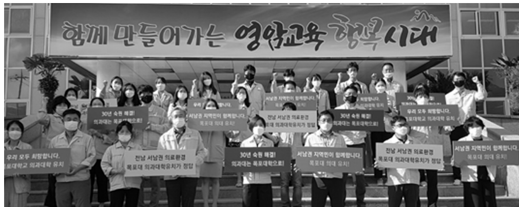
영암교육지원청(교육장 김성애)은 지난 5일 목포대학교 의과대학 유치를 희망하