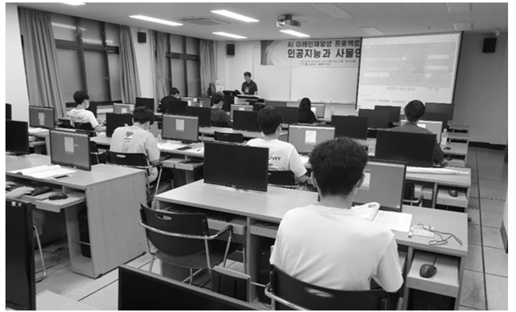
가 전남의 학생들이 4차 산업혁명 인공지 능 사회의 주인공으로 도약하는 데 큰 도 움이 되기 바란다."면서 "전남교육청은 미