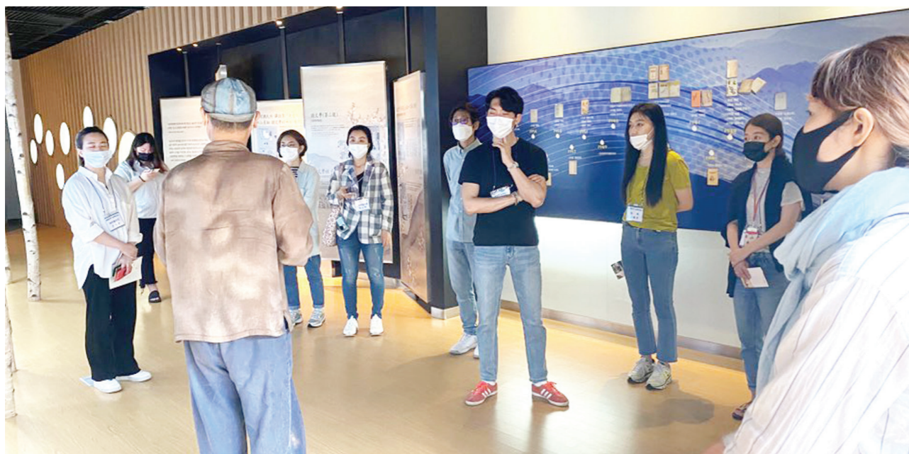
넥스트로컬 참여 청년창업자들이 강진군의 시문학파기념관을 방문해 강진의 문화와 역사, 인물에 대한 설명을 듣고 있다.

서울시, 강진군 등 13개 지자체와 함께 서울 청년 지역 창업지원 지역경제 활성화·청년창업 꿈 동시 실현 진행되는 프로젝트