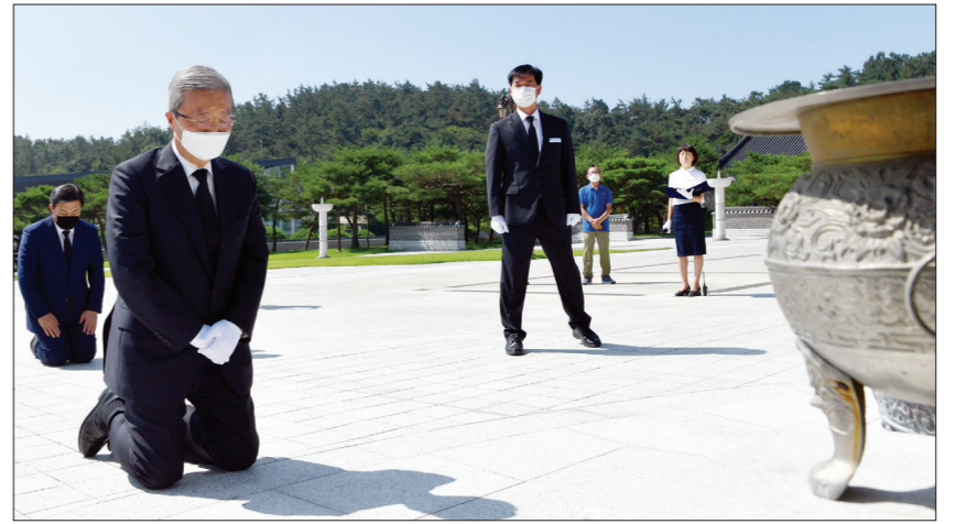
김종인 미래통합당 비상대책위원장이 지난8월19일 광주 북구 운정동 국립5·18민주묘지를 찾아 오일 영령 앞에 무릎을 꿇고 참배하고 있다.

이번 조사는 지난 12일부터 14일까지 사흘간 전국 18세 이상 유권자 3만4889명에게 통화를 시도한 결과 최종 1506명이 응답(응답률 4.3%)했다. 표본오차는 95% 신뢰수준에서 ±2.5%포인트다. 자세한 조사개요와 결과는 리얼미터 홈페이지 또는 중앙선거여론조사심의위원회 홈페이지를 참조하면 된다.