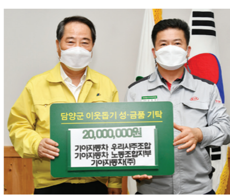
쌀쌀해진 날씨를 따뜻하게 답하는 이웃사랑의 손길이 담양군에 이어지고 있다. 담양군에 따르면 지난 14일 기아자동차

우리사주조합 기아자동차 노동조합지부 기아자동차(주)에서 성금 2,000만원, 전국건설노동조합 광주.전남건설기계지부 담양지회에서 200만원을 기탁했으며, 19일에는 전국금속노동조합 기아자동차지부 광주지회에서 1,245만원을 기탁하며 지역에 온정의 손길을 전했다. 기아자동차 우리사주조합 기아자동차 노동조합 기아자동차(주)는 지난해 12월에도 1,000만원을 기탁하는 등 매년 동절기마다 어려운 이웃을 위해 성금을 기탁하며 꾸준히 온정의 손길을 전해오고 있다. 또한 전국금속노동조합 기아자동차지부