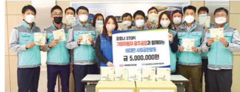
26일 기아자동차 광주공장 임직원들로 구성된 봉사단이 직접 만든 마스크스트랩세트 등이 포함된 감염증 예방 물품을 광주시 사회복지협의회에 전달하고 있다.

기아자동차 광주공장이 지역사회 경제적 취약계층에 코로나19 예방 물품을 추가로 지원했다. 기아차 광주공장은 26일 광주사업장 본관에서 광주사회복지협의회에 500만원 상당의 마스크와 마스크스트랩 400세트를 전달하는 비대면 사회공헌활동을 실시했다고 밝혔다. 예방물품 세트는 대화용 가능 마스크 2개와 마스크 고정용 스트랩, 마스크 보관용 에코백으로 구성됐다. 이 중 마스크스트랩은 임직원들이 취약계층 주민들의 개인방역에 도움을 주기 위해 직접 제작해 그 의미가 남다르다. 광주사회복지협의회는 지원 받은 물품을 한부모(조순)가정, 장애인, 노인 등 취약계층 400명에게 전달할 예정이다. 기동취재본부