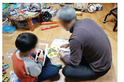
반겨 되어 오랜만에 가족이 함께 웃는 행복한 시간이 되었다”고 말했다. 진도=조상용기자

는 발레리나, 해시계 등 14개 프로그램을 운영, 가족이 함께 참여해 다양한 작품을 만들었으며, 완성된 작품을 통해 성취감과 자신감을 얻었다. 교육에 참여한 학부모들은 “코로나19로 인해 집안에서 생활하는 시간이 늘어나 우울감 등이 있었지만, 가족이 함께 참여할 수 있는 프로그램을 제공