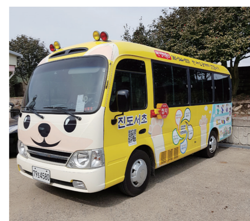
에게 친근감이 가도록 꾸몄다. 그리고 학교홍보 동영상을 QR코드로 제작하여 래핑시간에 담고 학교 전·입학 문의를 할 수 있도록 하였다. 진도=조상용기자

래핑디자인은 진도서초등학교 학생들이 직접 그린 그림과 진도교육 기본방향의 로고를 활용하였고, 차량 전면부는 천연기념물 제53호 진돗개 얼굴을 활용하여 아이들과 학부모