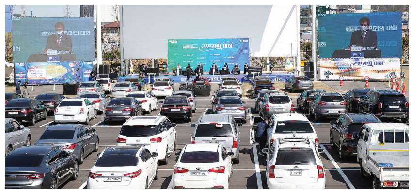
이상의 전남 함평군수가 22일 코로나19 예방을 위해 함평읍 자동차극장에서 군민과의 대화를 갖고 있다.

신 분야에서 높은 기여를 한 기관을 선정하는 상이다. 주요 선정 기준으로 △균형발전지표 △지역내총생산(GRDP) △기업유치 실적 △청년지원정책 △지역혁신 분야 노력 등을 평가한다. 신안군은 △신재생에너지 주민이익공유제 △1도(島) 1뮤지엄 △지역주민 생활안정지원(버스완전공영제, 여객선 야간운항) 등이 국가균형발전을 이끌수 있는 창의적인 정책으로 높은 평가를 받았다. 이 중 신재생에너지 주민이익공유제는 한국판 뉴딜 및 전남 블루이코노미 정책에 부응하고 사회적 갈등 해소