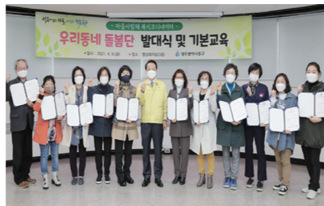
을 수 있기를 기대한다"고 말했다. 최윤희기자

동네 돌봄단'은 도움이 필요한 돌봄 이웃에 복지 서비스를 연계하고 마을사랑채에서 진행되는 다양한 복지사업에 참여하게 된다. 임택 동구청장은 "지역 사정을 잘 아는 주민들로 우리동네 돌봄단이 꾸려진 만큼 동별 특성에 따른 복지욕구를 잘 파악해 주시기 바란다"면서 "마을사랑채가 주민들의 소통·나눔·공유공간으로 자리 잡