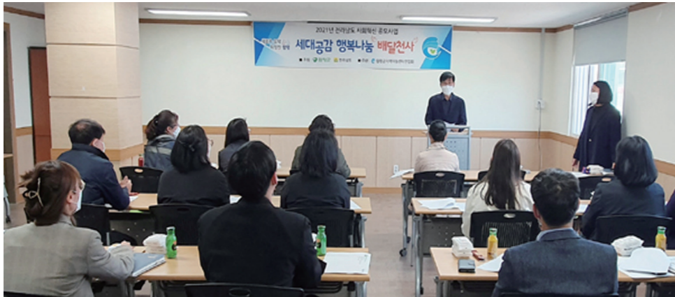
함평군은 지난 8일 함평군드림스타트 노인사업수행기관, 9개 읍면 복지업무 담당자가 참석한 가운데 간담회를 갖고

지난 3월 전남도 사회혁신 공모사업에 최종 선정 간담회 갖고 대상자 선정 논의...사업비 1270만원