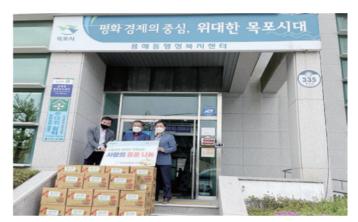
천하에서 감사드린다. 물품은 필요한 주민들에게 잘 전달하겠다. 목포=박정수기자

쌀과 라면을 후원하게 되었다"며 "취약계층을 위한 나눔 행사를 함께 진행하게 되어 더욱 뜻 깊은 일인 것 같다"고 전했다. (재)광양시사랑나눔복지재단 관계자는 "이웃사랑 실천을 해주신 동광양상공인회에 감사의 말씀을 드린다"며 "앞으로도 지역사회를 위해 함께해 주시길 바란다"고 말했다. 광양=심종섭기자