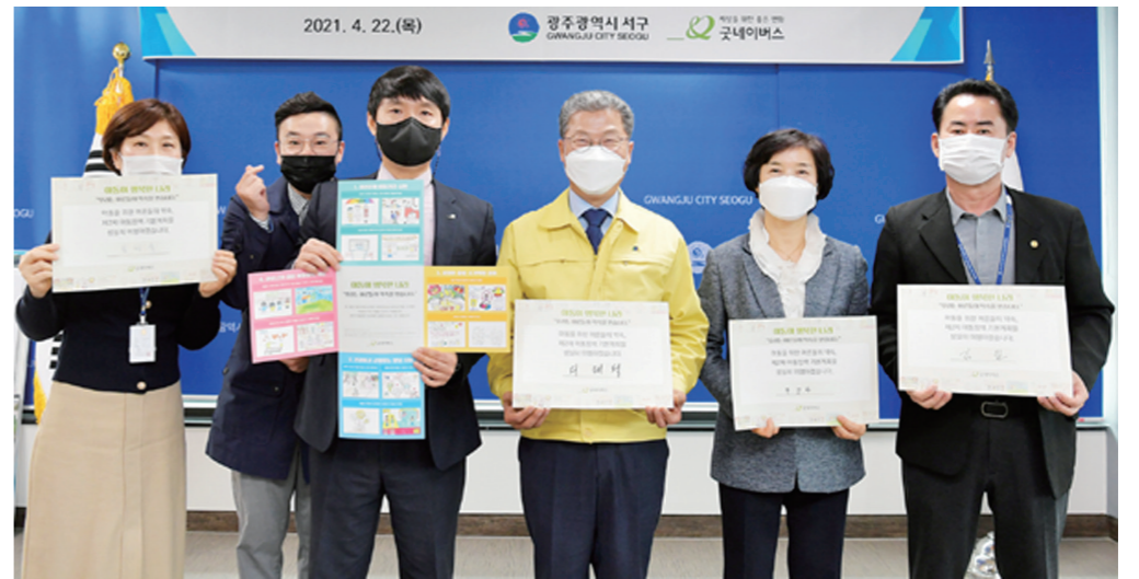
지자체 및 기업들과 협력하여 지역사회 내 다양한 문제를 해결하고 아동권리 증진을 도모하는데 앞장서고 있다.