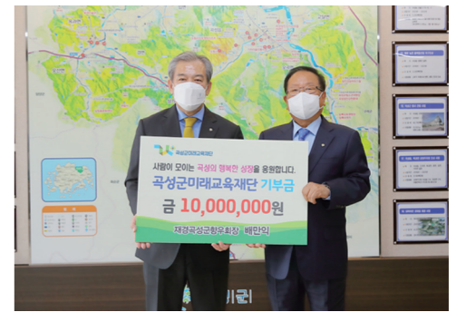
이 돌아가게 되며, 5월 초 대학생 70명에게 1인당 최고 200만원, 고등학생 30명에게 1인당 50만원의 장학금을 지급할 계획이다.

한편, 재단에 따르면 장학금 기부가 늘어남에 따라 올해는 더 많은 학생들에게 장학혜택