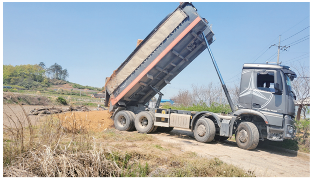
마을 상수도 관정 부근 오폐수 유입 매립작업 장면