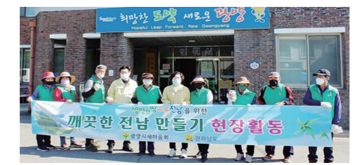
만드는 데 일조하고 있으며, 재난관리-안전의 식 UP 캠페인'을 전개하는 등 주민복지를 위해 다양한 봉사와 사회활동을 펼치고 있다. 광양=심종섭기자

옥곡면 새마을지도자협의회와 부녀회는 정기적인 클린데이 운영으로 쾌적한 마을환경을