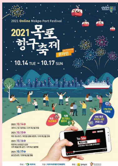
목포시의 대표축제인 '목포항구축제'가 오는 14일부터 17일까지 코

내일부터 17일까지 라이브커머스·TV홈쇼핑 특산물 판매·목포 파시 퀴즈 등 진행