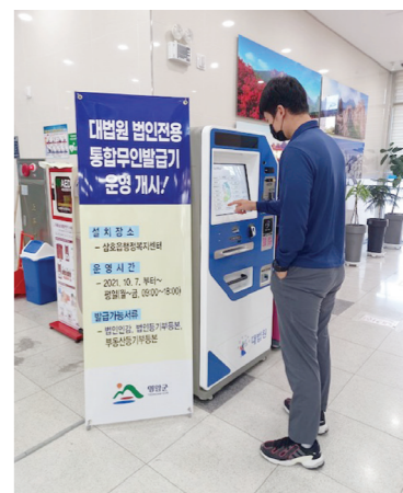
무인민원발급기를 운영할 수 있게 된 것이다.

그동안 영암군 삼호읍 소재 기업 관계자들은 법인 관련 민원서류를 발급받기 위해서 차량으로 30분 거리에 있는 영암읍 영암군 등기소를 방문하거나, 목포지방법원을 직접 방문하여 법인 관련 민원서류를 발급받아야 하는 번거로움이 있었다. 영암군은 기업체들의 이러한 불편 사항을 해결하기 위해 대법원 법원행정처와 올해 초부터 지속적인 업무협의를 통해 도내 처음으로 영암군의 총 49%가 소재한 삼호읍에 법인전용