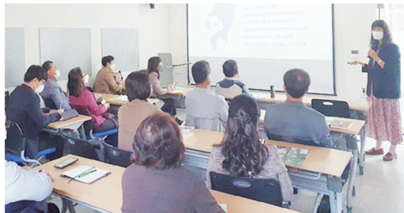
함께 고민하는 ‘담양교육비전 대토론회’를 12월에 개최하고자 준비하고 있으며 미래로 감동 주는 담양교