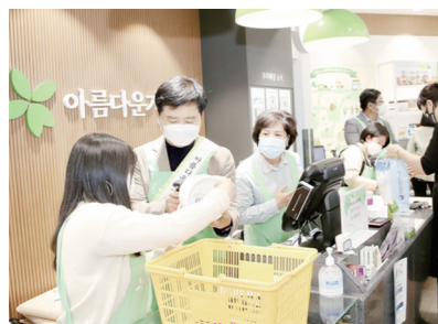
전라남도교육청(교육감 장석웅)이 22일 아름다운가게 목포하당점에서 자원 재활용과 나눔 문화 확산을 위해 ‘전남교육청과 함께하는 아름다운 하루’ 행사를 개최했다.