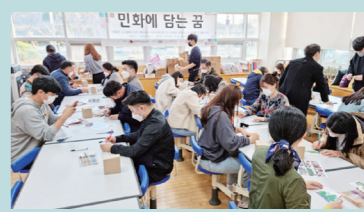
그램에 참가하였으며 마스크 쓰기와 거리두기의 방역지침을 준수하며 자연의 멋과 맛을 느끼고, 사색과 체험을 통해 만족스럽고 유익한 시간을 보냈다.

힐링 프로그램으로는 △다산 청렴 강의의 △다산체험을 위한 백련사 사색의 길 걷기 및 다산초당 둘러보기 △다산박물관 관람 △강진을 식문화체험 △가우도 짚트랙 체험 △민화채색체험 등 다양하게 진행되었다. 1박 2일 동안 참석자들은 손소독과 발열체크를 마치고 프로