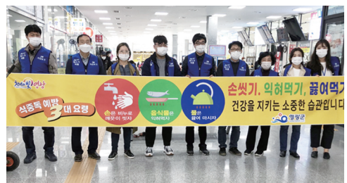
영광군은 최근 ‘식중독 예방 및 음식 덜어먹기’라는 주제로 터미널 시장 일원에