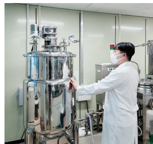
순천시는 특화 농공단지 조성과 더불어 외서면이 바이오산업의 메카가 될 수 있도록 전방위적 지원을 아끼지 않을 예정이다.

더불어 지역 자원을 활용한 소재 개발 등 지역민들과의 상생발전과 기업 사업화 지원을 통한 지역 기업의 육성, 농가 소득 증대로 지역의 경제발전에 기대된다.