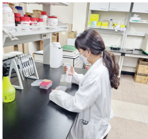
핵심인력과 함께 농공단지가 본격적으로 착공될 예정이다.

2025년까지 약 9만평 규모로 조성될 외서 특화농공단지는 천연소재 산업이 미래 산업의 중심이 됨에 따라 관련 산업을 유지하고 발전시키는 것을 목적으로 한다. 현재 조성예정면적의 80% 이상에 관련 업체들이 입주 의향을 제출한 상태로, 이를 바탕으로 전라남도 예타당성조사 심사 승인을 요청했다. 특화농공단지 지정 승인이 완료되면 농공단지개발