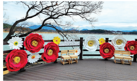
광 공식 인스타그램 '광양투어(gwangyang_tour)'를 활용한 이벤트도 운영한다.