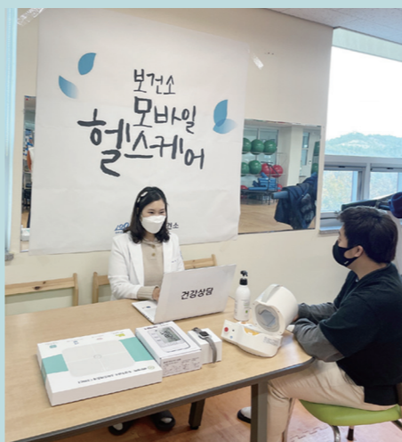
고 밝혔다. 신안=이덕주기자

요인(혈압, 공복혈당, 허리둘레, 중성지방, HDL-콜레스테롤)이 많은 대상자를 우선으로 선정하고, 관련 질환을 진단받거나 약물을 복용하는 사람은 제외된다. 최종 대상자로 선정된 사람은 6개월(24주) 동안 보건소 영역별 전문가(의사, 코디네이터, 간호사, 영양사, 운동전문가)로부터 건강, 영양, 운동 등 맞춤형 건강관리 서비스를 제공받는다. 신안군 관계자는 "ICT를 활용한 비대면 건강증진 서비스 확대로 보건소 방문이 어려운 지역주민의 만성질환 예방과 자가건강 관리 능력 향상을 위하여 최선을 다하겠다"