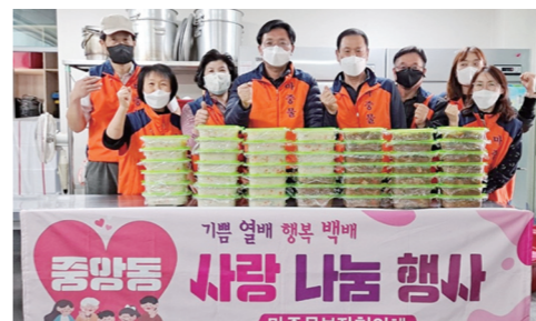
순천시 중앙동 마중물보장협의체는 최근 지역 내 홀몸어르신, 장애인 등 취약계층 관리를 통해 발굴한 24가구에 '건강 영양죽(전복죽)과 소불고기양념반찬 나눔'사업을 펼쳤다. 건강영양죽 전달사업은 마중물보장협의체

위원들이 지속적인 어르신 안부살피기를 통해 식사를 소홀히 해 영양결핍이 우려되거나 치아가 약해 음식섭취가 어려운 분들의 건강회복을 위해 추진하게 됐다. 이날 마중물위원들은 창조센터 공유부에서 활전복과 친환경 야채 등 식재료를 사용하여 직접 조리하여 전복죽을 만들었다. 또한 매월 무명의 독지가로부터 후원받아 추진하고 있는 소불고기 양념반찬도 같이 준비했다. 마중물 위원들은 준비한 건강 영양죽(전복죽)과 소불고기 양념 반찬을 전달하며 어르신의 안부와 건강을 살폈다. 순천=김승호기자