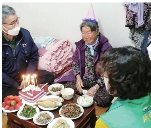
장흥군 회진면지역사회보장협의체에서는 만 90세이상 장수어르신(3월생 2명) 생신을 맞