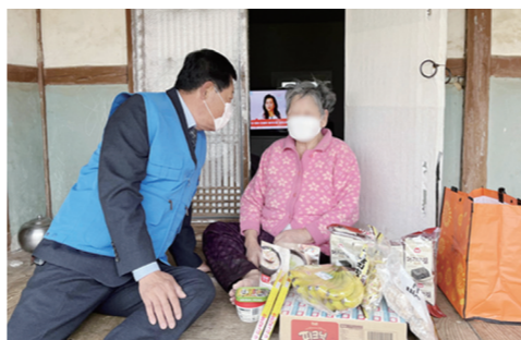
독거노인 등 12가구 대상 무안군 현경면 지역사회보장협의체는 최근 거동이 불편한 독거노인 등 취약계층 12가구를 대상으로 월 1회 제철과일과 밀반찬을 배달하는 서비스를 시작했다고 밝혔다. 이 사업은 현경면 지역사회보장협의체 특화 사업으로 스스로 식사해결이 어려운 대상자에

게 제철과일과 밀반찬 배달 서비스를 지원함으로써 건강한 생활을 도모하기 위해 마련됐다. 이날 협의체 위원들은 코로나19 확산방지를 위해 최소한의 인원으로 방역수칙을 준수한 가운데 각 가정을 방문해 건강상태와 안부를 확인하는 등 복지안전망 역할을 수행했다. 무안=이성기 기자