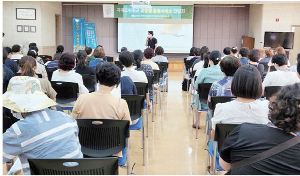
계 고민할 과제"라며 "담양군의 치매 어르신들을 돌볼 수 있는 촘촘한 안전망을 갖추겠다"라고 강조했다. 담양=박종영기자

봄 관리 등을 수행할 계획이다. 지난 6일에는 담양군노인복지타운 생활지원사 70여 명을 대상으로 치매인식개선 및 파파너 교육과 돌봄서비스에 필요한 인지꾸러미 활용 방법에 대해서도 설명했다. 한편, 치매안심센터는 지난해에도 188명을 대상으로 돌봄 서비스를 실시해 인지선별검사 0.9점 향상과 주관적 기억 감퇴 0.63점 감소 등의 효과를 거두며 삶의 활력 향상에 기여했다. 군 관계자는 "치매는 더 이상 개인이나 가족에게 국한된 문제가 아니라 지역사회가 함