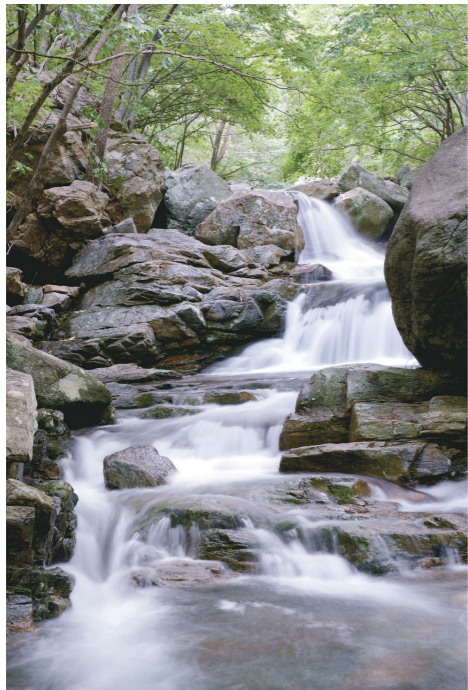
백두대간에서 갈라져 나와 호남정맥을 완성하며 장엄하게 우뚝 솟은 백운산(1,222m)은 맑은 물과 수려한 풍광을 자랑하는 4대 계곡을 거느리고 있다. 성불·동곡·어치·금천 등 네 개의 손가락