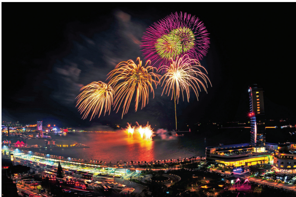
여수세계박람회 10주년 기념 '사진·포스터 공모전' 당선작이 12일 발표됐다. 여수시에 따르면 5월 31일부터 한 달간 진

473점 공모, 분야별 최우수상 등 38명 선정...총 상금 700만원, 박람회장 전시